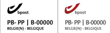
Fig.1: Port Betaald-frankeermerk 1

Een frankering met postzegel geeft geen recht op het Direct Mail-tarief.