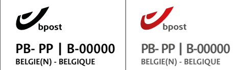
Fig.1: Port Betaald-frankeermerk 1

Een frankering met postzegel geeft geen recht op het Direct Mail-tarief.