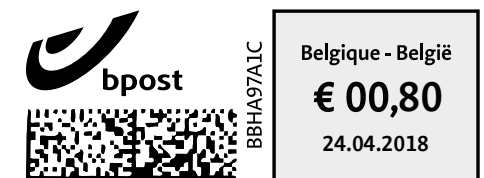
Fig.2 : Empreinte de machine à affranchir

Largeur : minimum 20 mm / maximum 30 mm Hauteur : minimum 15 mm / maximum 20 mm