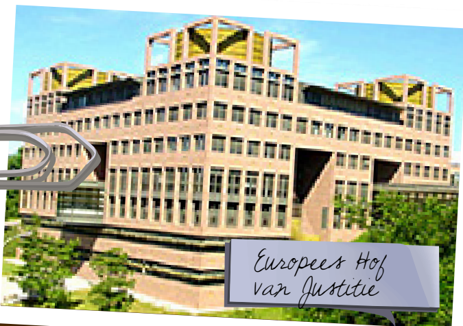
Europees Hof van Justitie

Neem de leerlingen mee naar Brussel voor een wandeling door de Europese wijk.