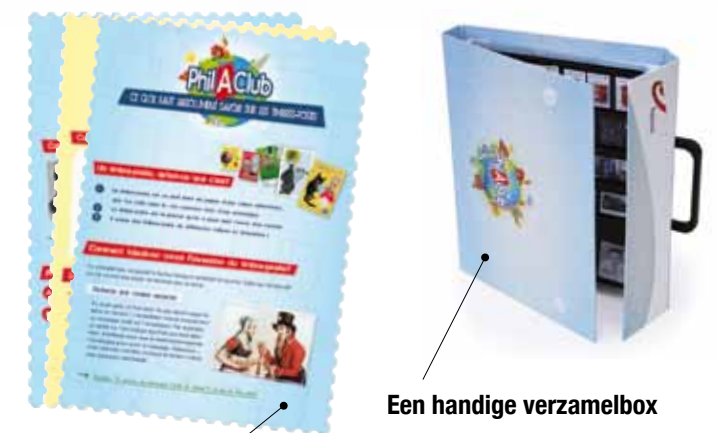
Een handige verzamelbox