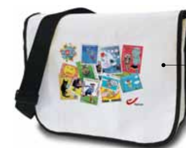
Nieuw in het aanbod van 2012: een leuke draagtas van de Phil-A-Club