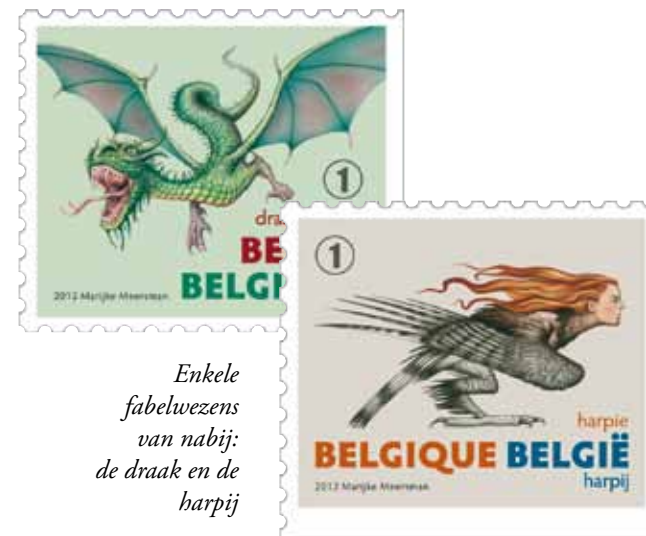
Enkele fabelwezens van nabij: de draak en de harpij

Wie ooit Latijn of Grieks volgde, herinnert zich het verhaal van Pegasus nog wel. De gorgo Medusa en de zeegod Poseidon brachten dit gevleugelde paard ter wereld. Pegasus mag zeker niet verward worden met een Centaur. Dit beest is, zoals sommigen zich uit Harry Potter herinneren, half man en half paard. Uit verhalen blijkt dat centauren mensen waren uit de bossen van Tessalië die er in holen en bergen woonden en zich voedden met rauw vlees. De griffioen is een tijdgenoot van